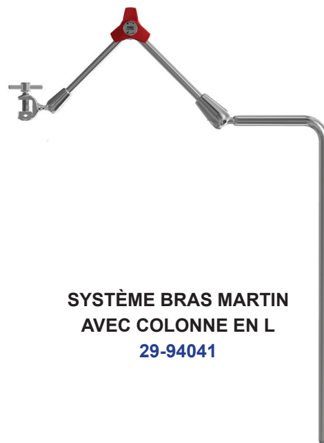
SYSTÈME BRAS MARTIN AVEC COLONNE EN L 29-94041