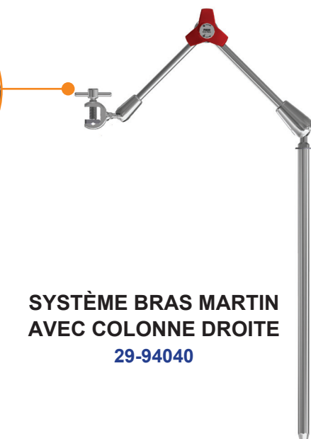
SYSTÈME BRAS MARTIN AVEC COLONNE DROITE 29-94040