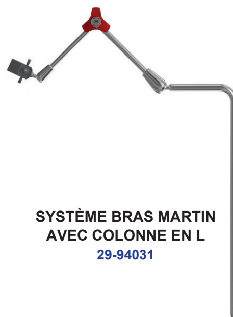
SYSTÈME BRAS MARTIN AVEC COLONNE EN L 29-94031