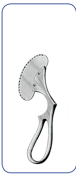
SCIE ENGEL 16 cm 31-10514 lame seule 31-10515