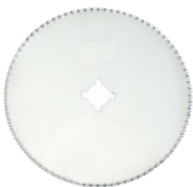
LAME POUR PLÂTRE NATUREL