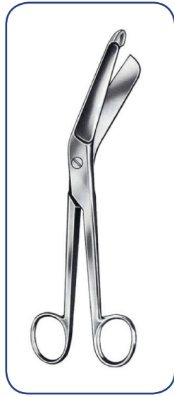
BERGMANN 23 cm 17-43923