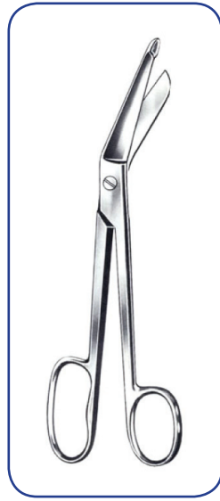
LISTER grand anneau 18 cm 17-43818