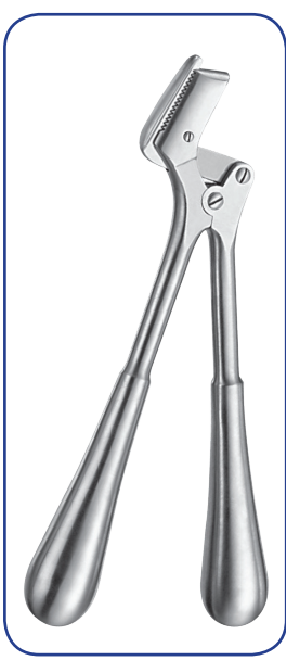
STILLE écarteur 37 cm 31-10337