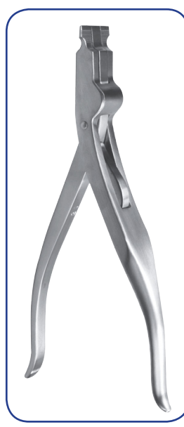
MODÈLE USA écarteur 23 cm 31-10323