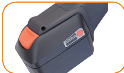
Changement facile de l'accumulateur

L'alimentation électrique de cette scie oscillante universelle est assurée par un accumulateur de haute capacité.