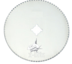
LAME POUR BANDAGE SYNTHÉTIQUE