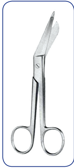
LISTER 14 cm ..... 17-43914 18 cm ..... 17-43918 20 cm ..... 17-43920