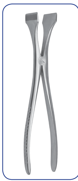
HENNING écarteur 28 cm 31-10428