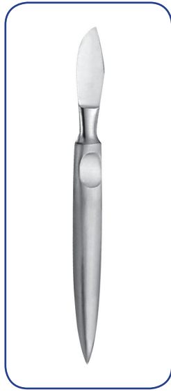
ESMARCH couteau à plâtres 18 cm 31-10618