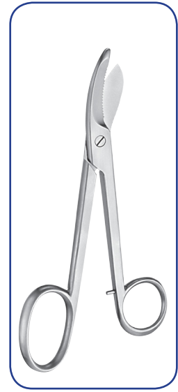
BRUNS 23 cm lames dentelées 17-43324 lames lisses 17-43424