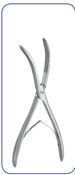
WOLF écarteur 18 cm ..... 31-10718 24 cm ..... 31-10724