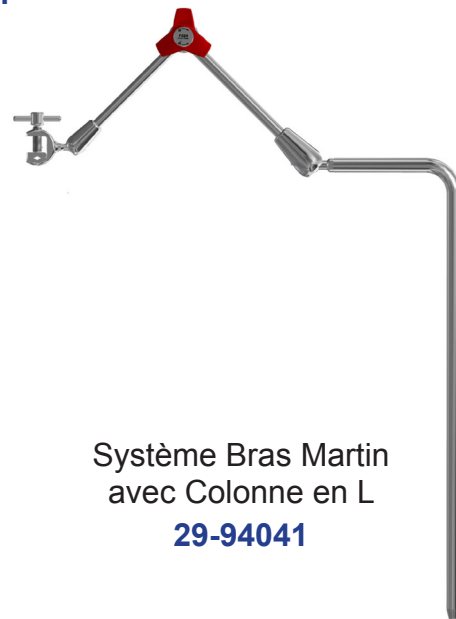
Système Bras Martin avec Colonne en L 29-94041