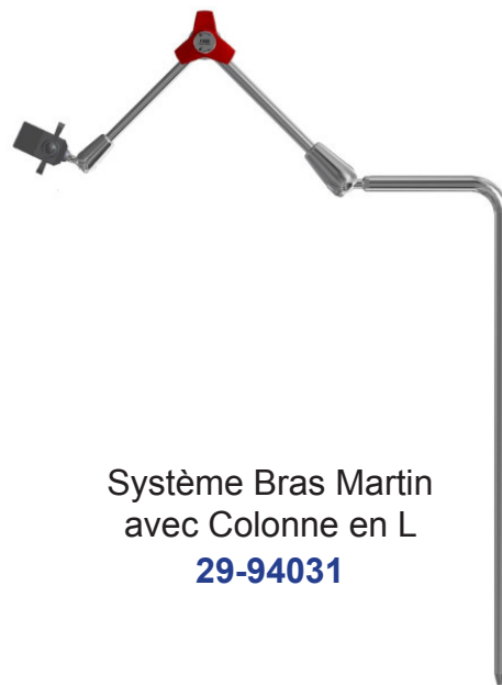
Système Bras Martin avec Colonne en L 29-94031

MODÈLE DE BRAS ARTICULÉ POUR LA CHIRURGIE BARATRIQUE : NOUS CONSULTER