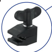
Système Bras Martin avec Colonne Droite 29-94030