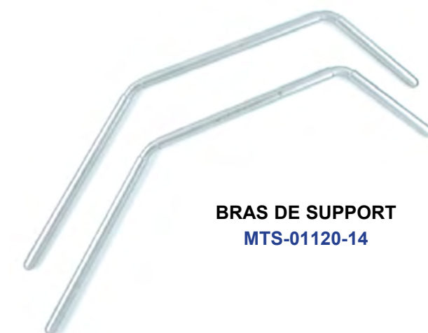
BRAS DE SUPPORT MTS-01120-14