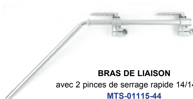
BRAS DE LIAISON avec 2 pinces de serrage rapide 14/14 mm MTS-01115-44