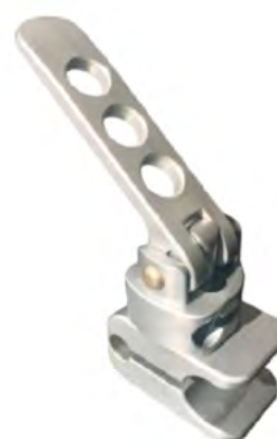
PINCE DE SERRAGE RAPIDE MTS-01130-45