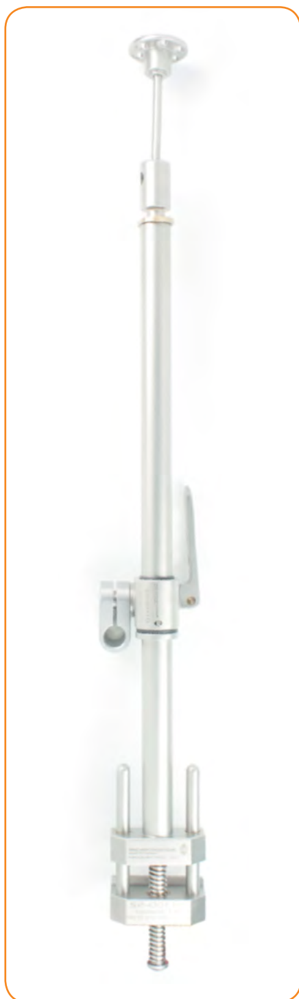
PINCE DE FIXATION POUR RAIL modèle standard 20/14 mm MTS-01100-62